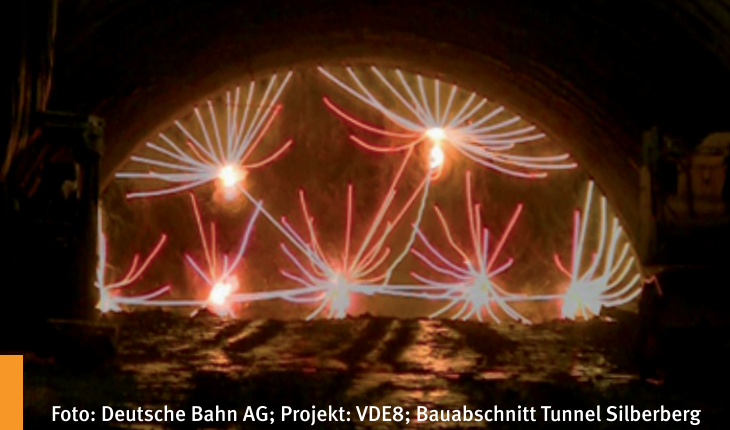
Projekt: VDE8; Bauabschnitt Tunnel Silberberg