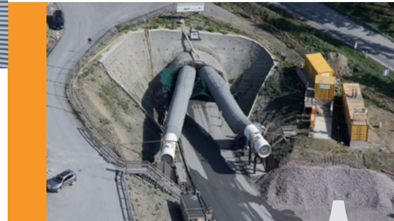
Aus- und Neubaustrecke Nürnberg-Berlin (VDE8)